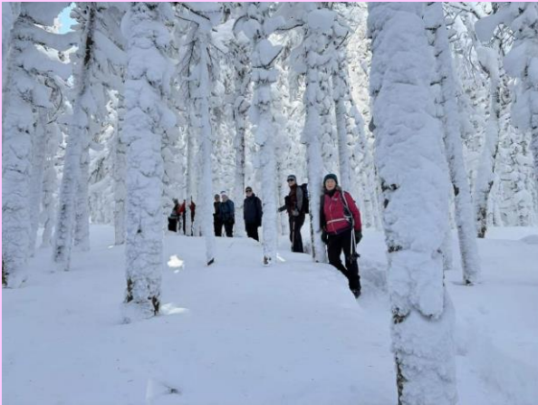
Massif du Sud