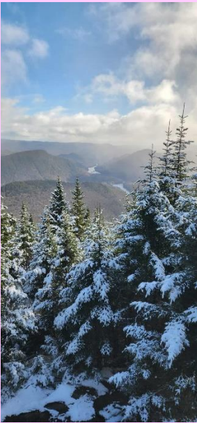
Vallée Jacques Cartier