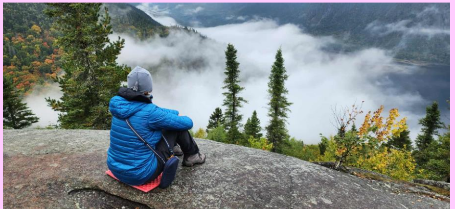
Fjord du Saguenay