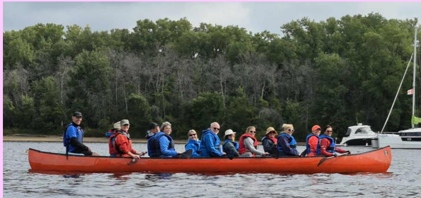
Rabaska Rivière St-Maurice